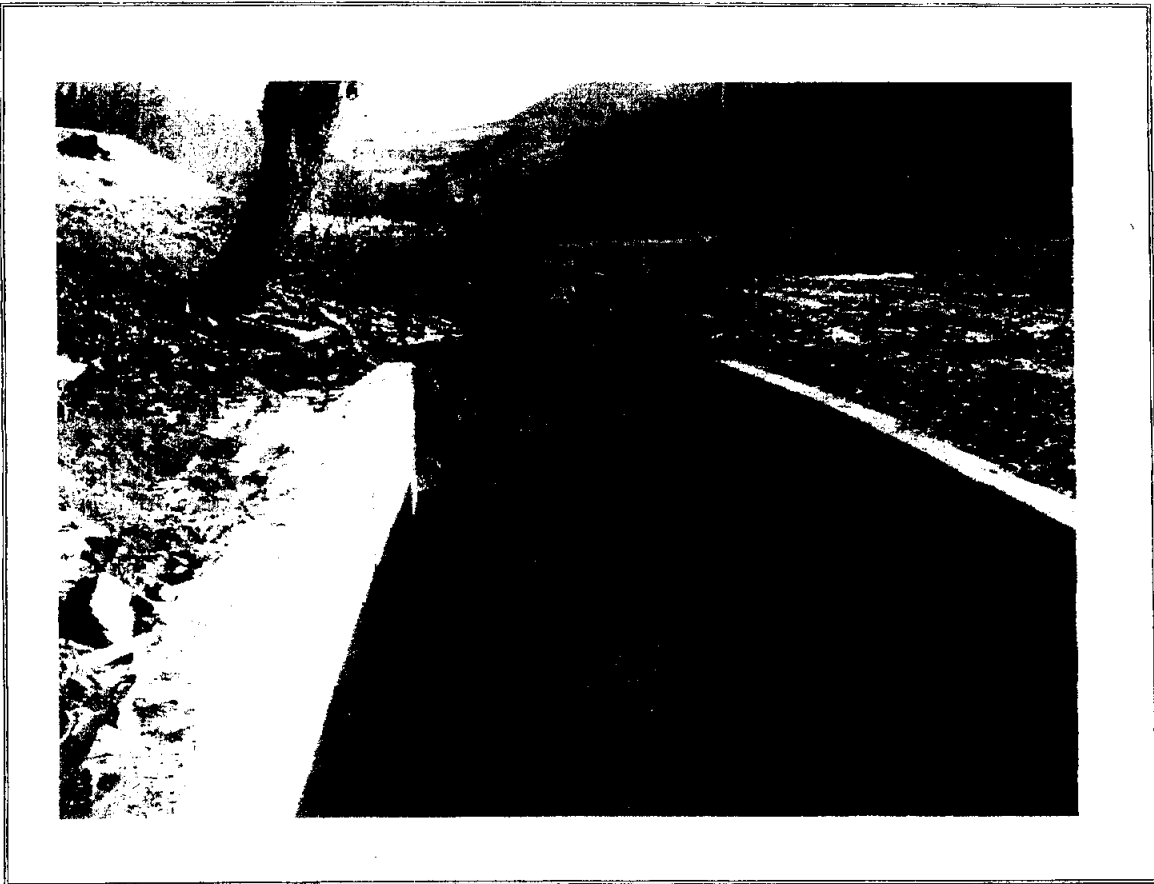
■ 사례실 소하천 수해복구공사 보완