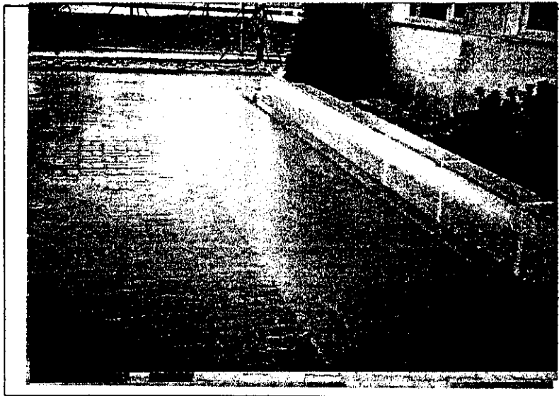
<노인복지관 배수시설 보양>