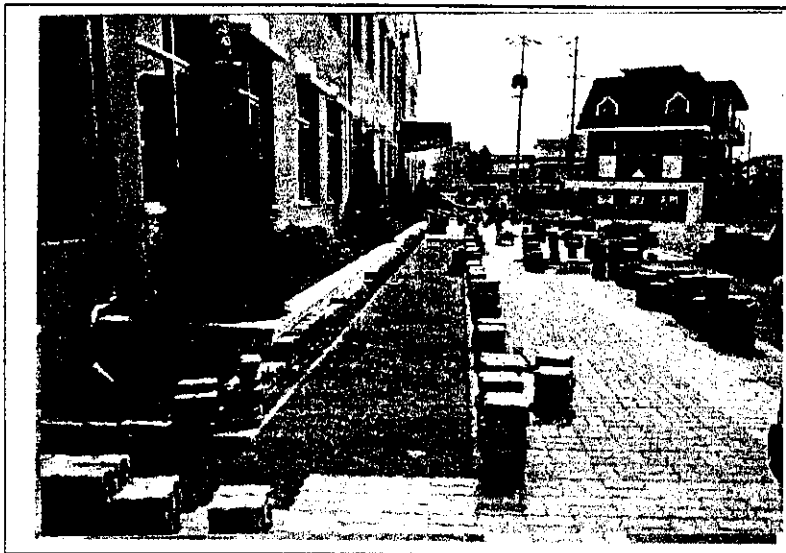
<노인복지관 배수시설 보완>