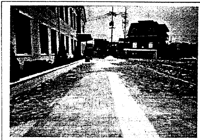
<노인복지관 보도블럭 시정>