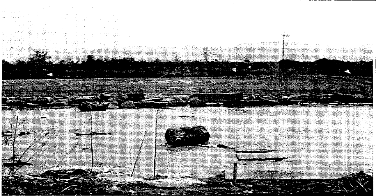
징검다리 보수 전, 중