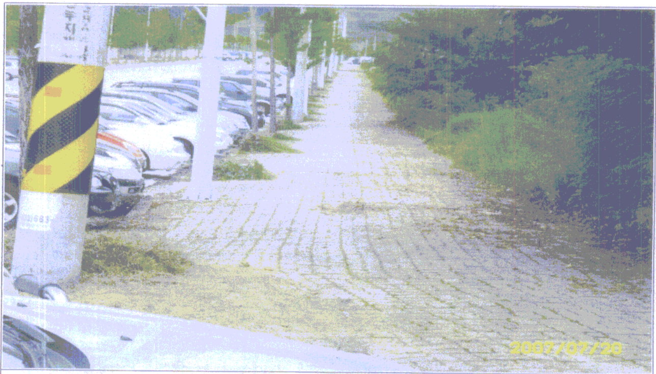
산업단지 제초작업 후