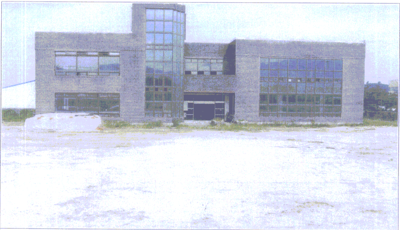
산업단지 관리사무소 토사이동 후