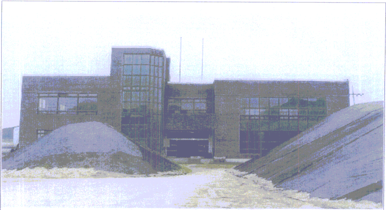
산업단지 관리사무소 토사이동 전