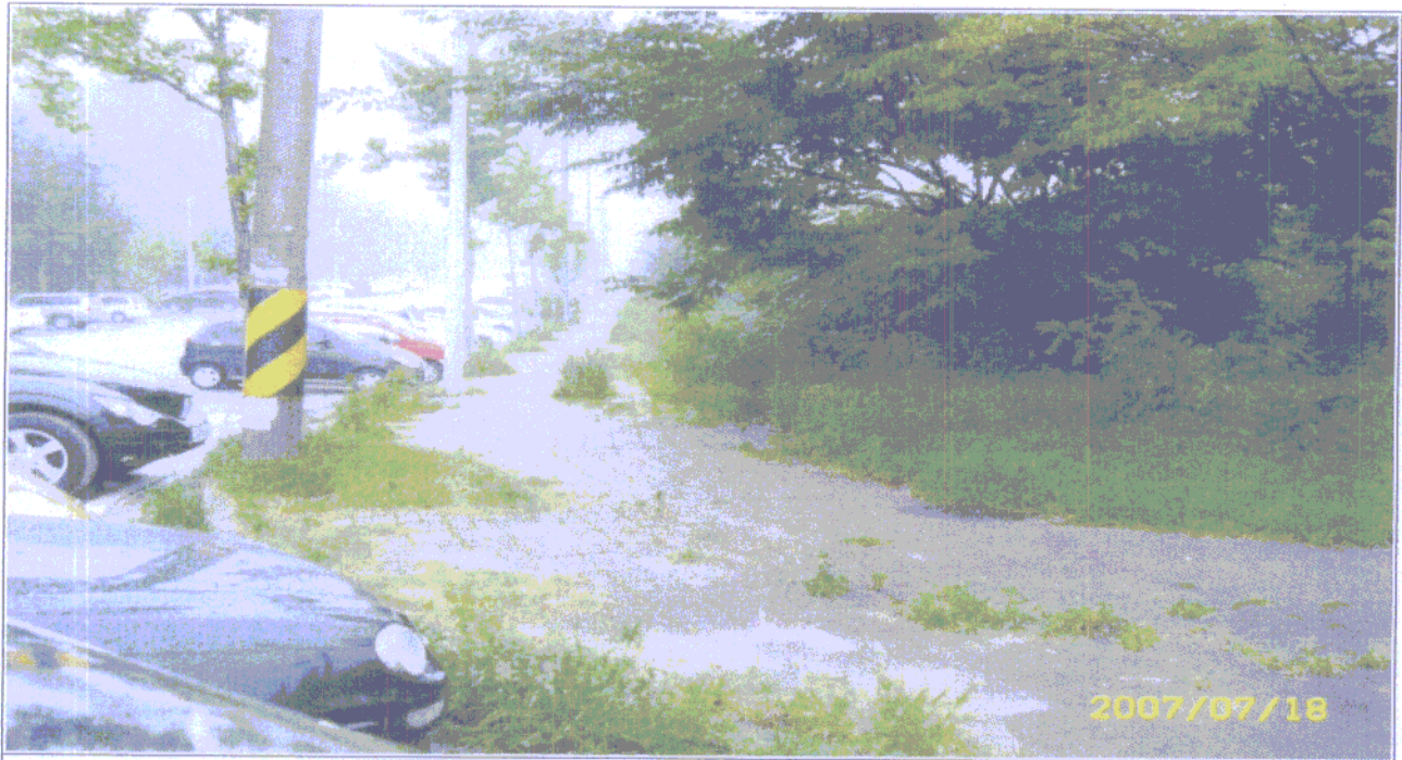
산업단지 제초작업 전