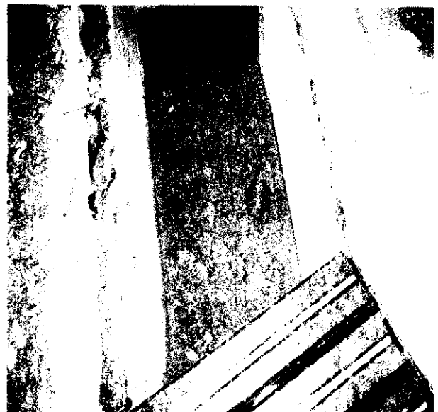
○ 배수로 토사 정비 완료