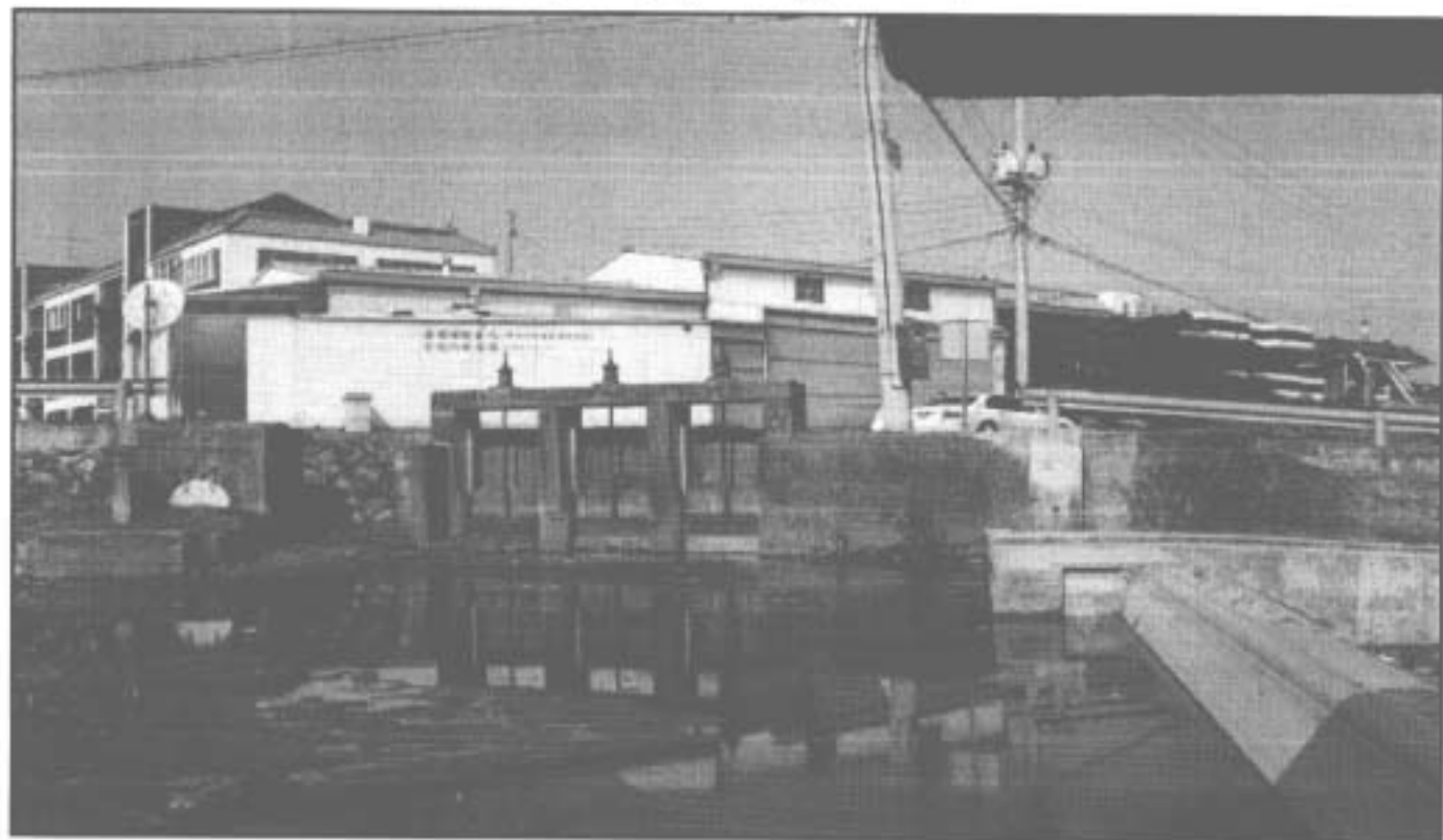
사진설명 : 사천개보 취입문