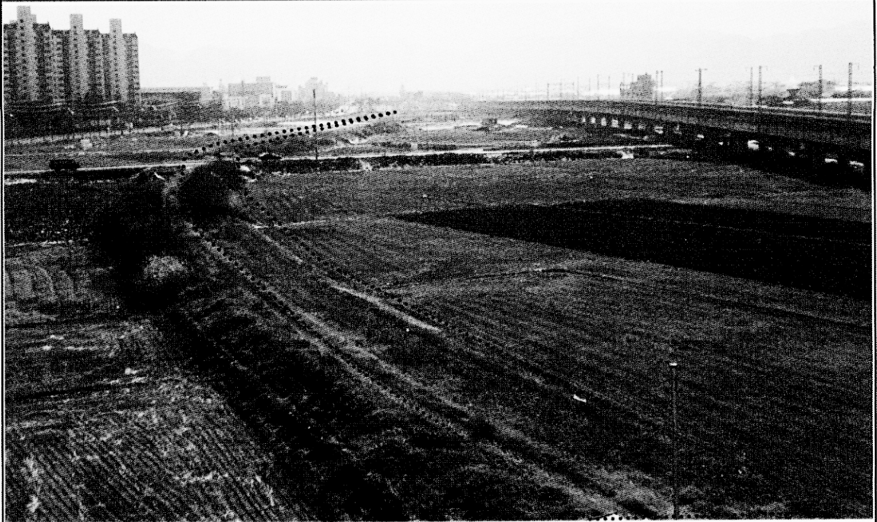
삼원철도 개량사업 신철도부지 (충주시 → 국토해양부)