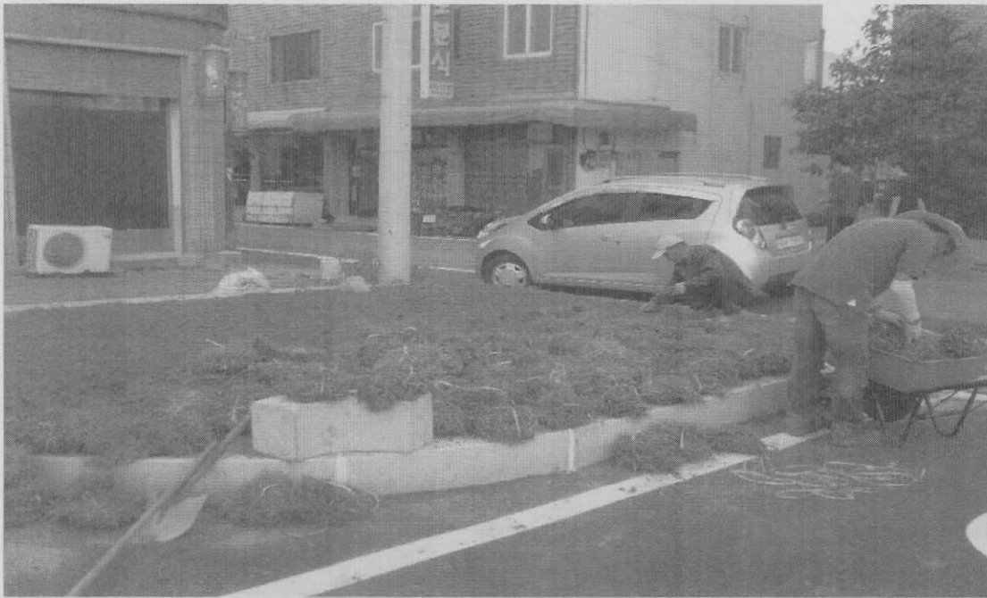
사진설명 화단 잔디 식재중