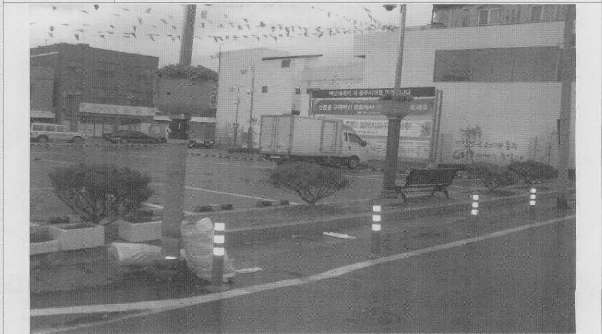
사진설명 대체 후(반송 식재)