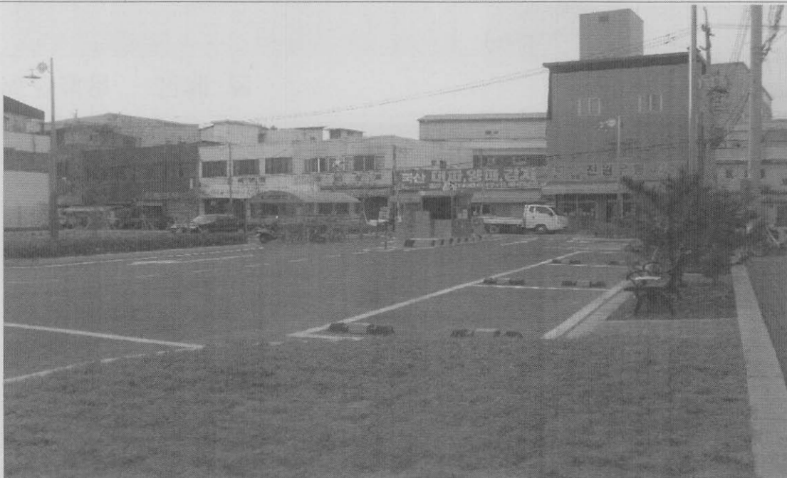
사진설명 화단 잔디 식재후