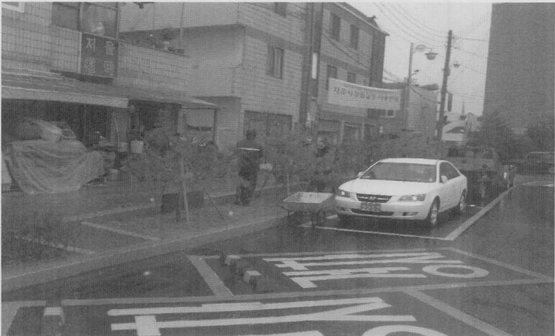
사진설명 교체 전