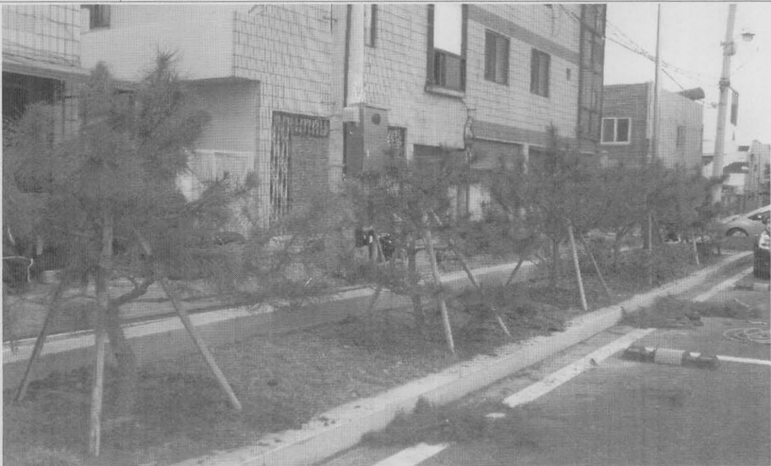
사진설명 교체 후, 전정작업 실시