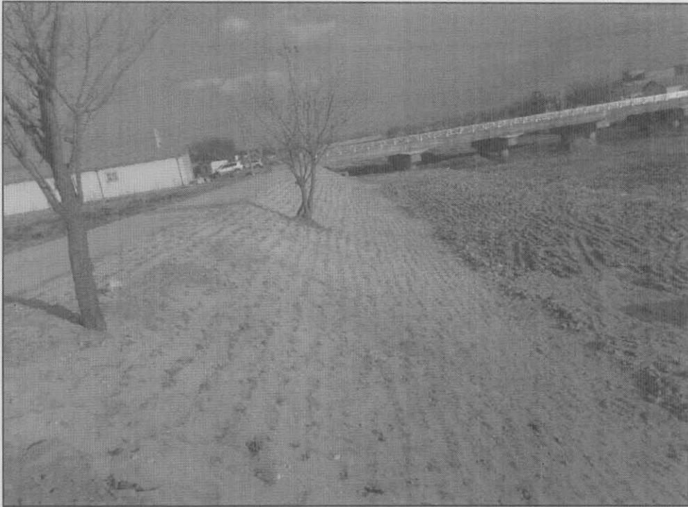
공사차량 진출입사면 잔디식재