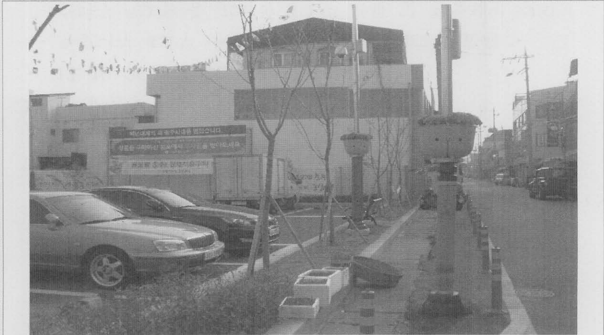
사진설명 대체 전