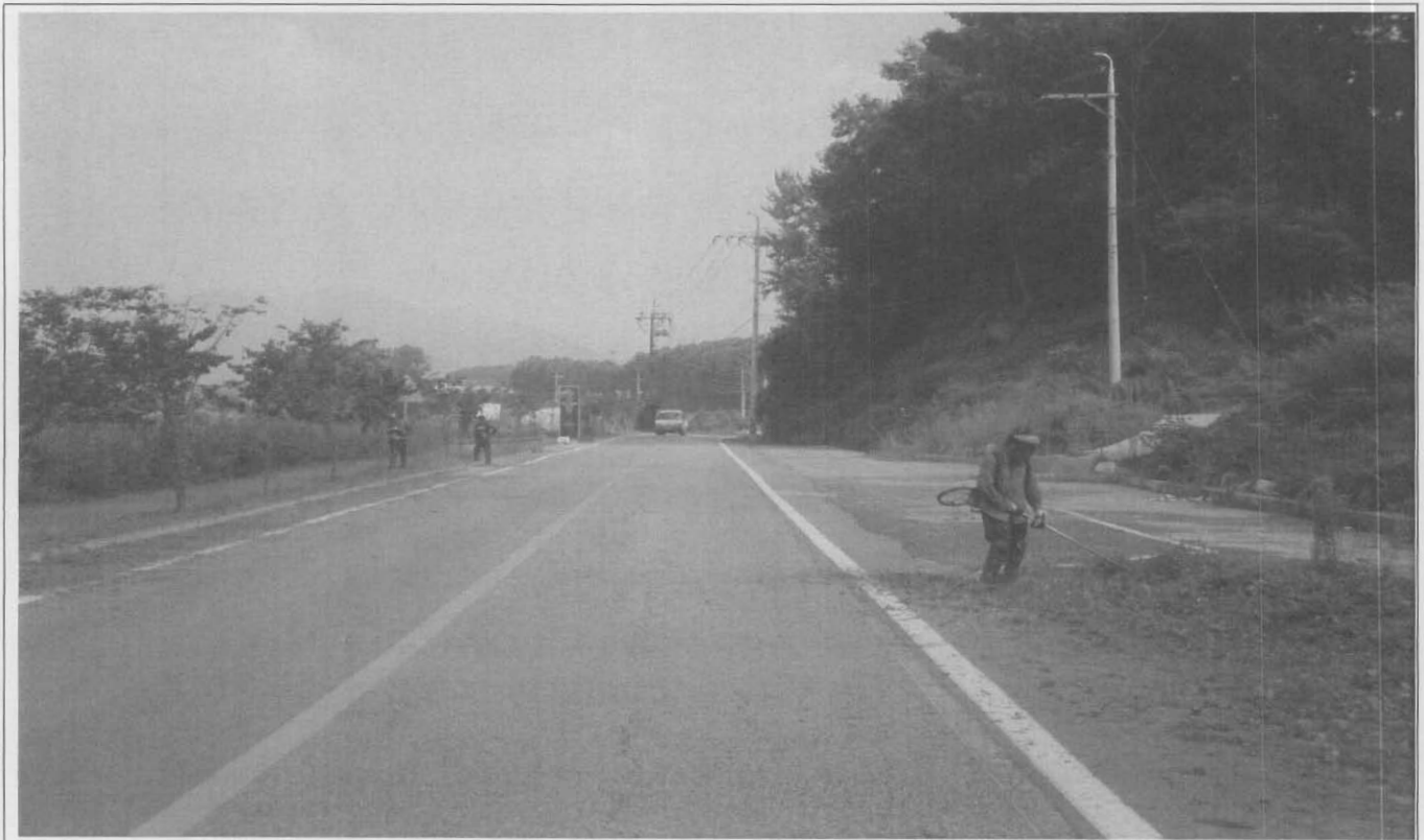
자전거도로변 제초 작업