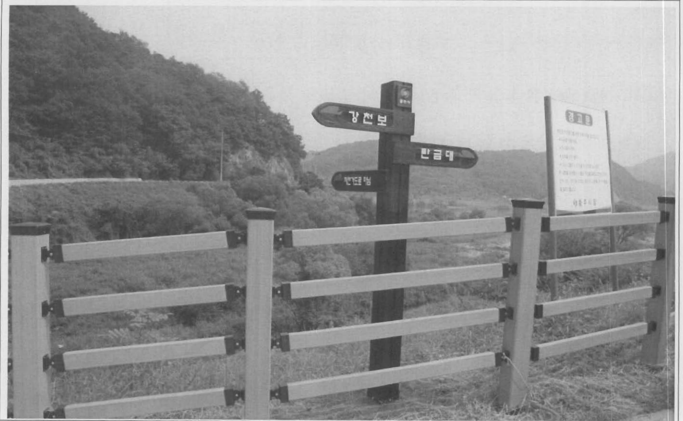
이정표 설치 사진