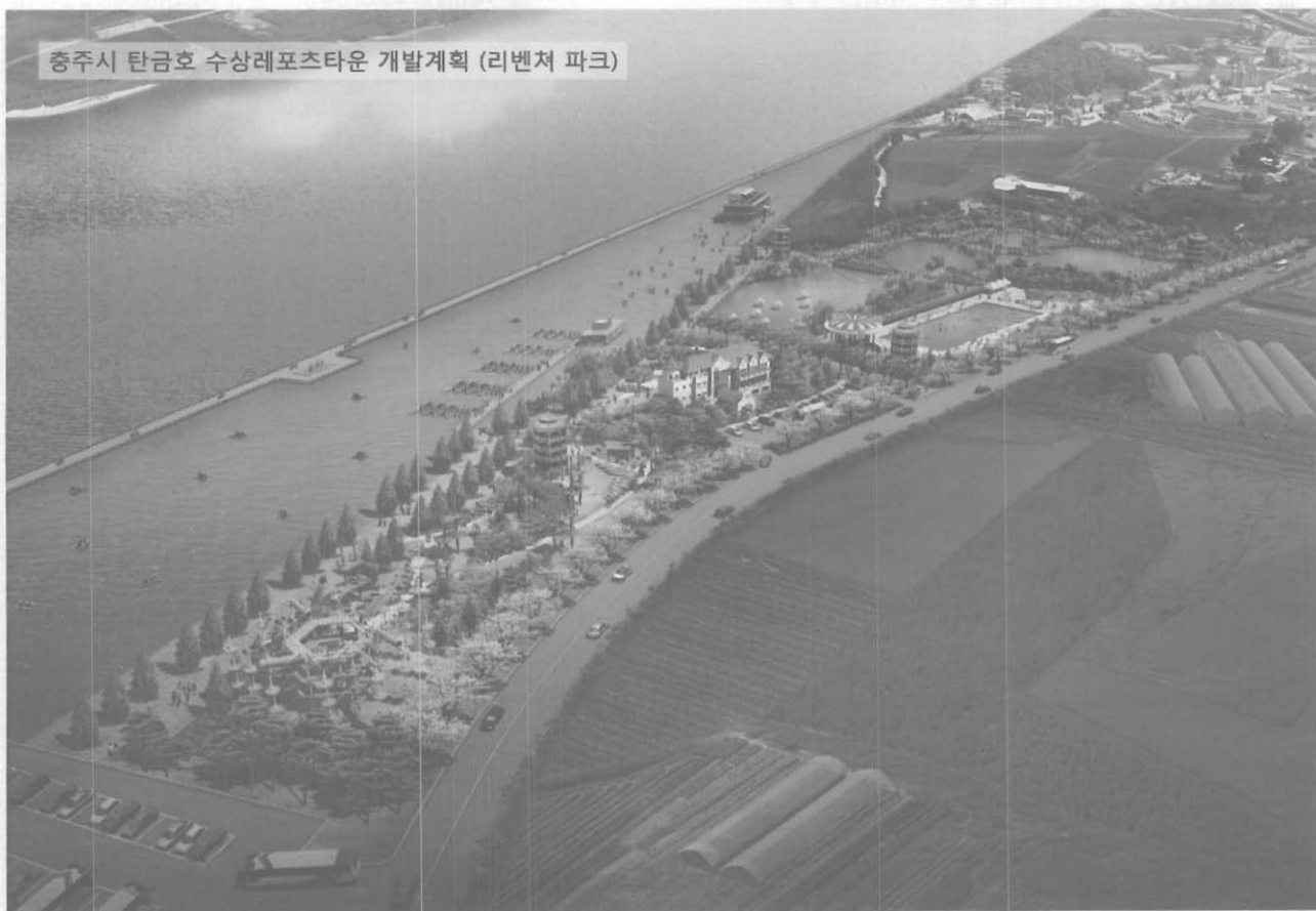
충주시 탄금호 수상레포츠타운 개발계획 (리벤처 파크)