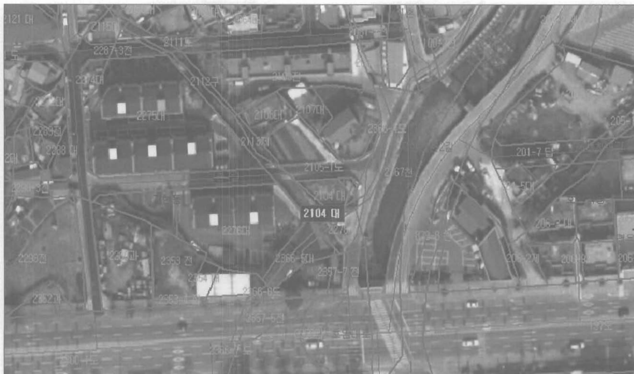
위치 : 지현동 2104대