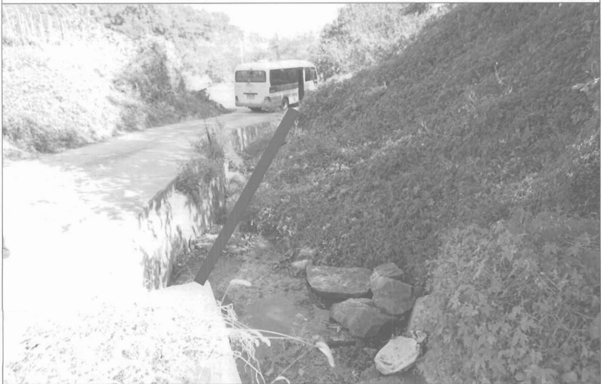
현장사진: 향후 공사 시점부로부터 30m가량 복개공사 추진